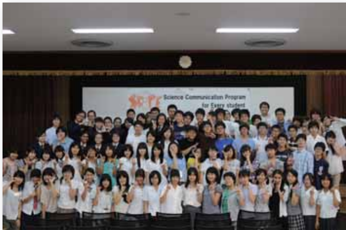
SCoPE2012を奈良女子大学で実施したときの集合写真

シンガポール (Yishun Town Secondary School, Nan Chiau High School, Regent Secondary School) 15名