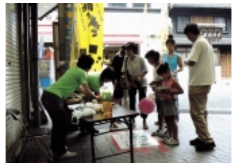
餅飯殿双六の様子