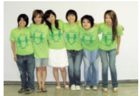
学生デザインのスタッフTシャツ