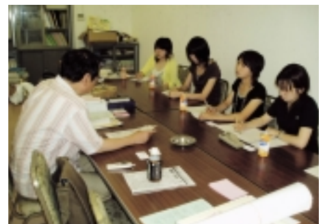
商店街調査の様子