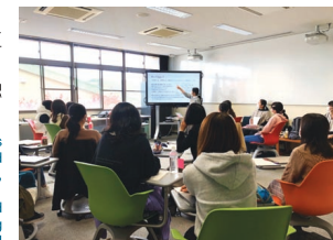
文理融合講座の様子

Our missions are: 1) to review and develop science and mathematics education in secondary and higher education, 2) to encourage female high school students to major in science and engineering subjects, 3) to develop female leaders in science and engineering fields, and 4) to develop STEAM education which is critical to science and engineering education based on liberal arts.