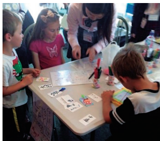
グローバル女性人材プログラムでの日本文化紹介イベント

The center is comprised of the International Exchange Planning Section and the International Education Section. The former carries out the planning and implementation of international exchange and promotes activities based upon academic exchange agreements. The latter offers education and support to international students and guidance for Japanese students going abroad.