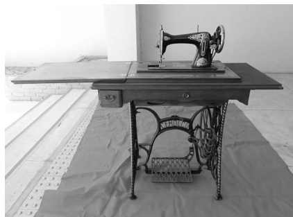
海外製足踏み式ミシン

奈良女子大学には、前身である奈良女子高等師範学校以来の長い被服教育の歴史があり、多くの教材や作品が残されています。今回の特別展示では、昭和初期頃(一部戦後)までを対象に、実物と同じデザインと縫い方で寸法のみを縮めた裁縫雛型、パーツ縫いや仕末法を伝授するための見本教材、素材研究や教材入手のための布見本や糸見本などを、家事科の授業日誌や学級日誌といった文字史料とともに紹介します。