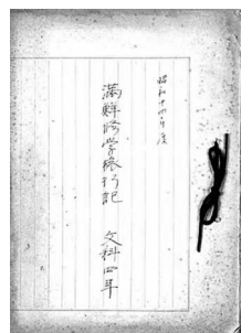
昭和十四年度 満鮮修学旅行記 (文科四年)