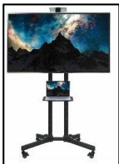
サーモカメラ と 確認モニター