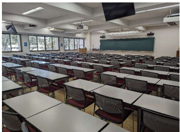
例1 イス・机移動可(N101)