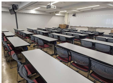
例2 イス移動可・3人掛け長机(N302)